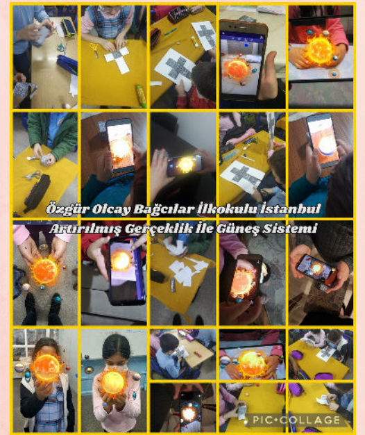
ARTIRILMIŞ GERÇEKLIK İLE GÜNEŞ SİSTEMİMİZ