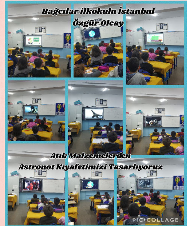
ASTRONOT KİYAFETİ TASARLIYORUZ