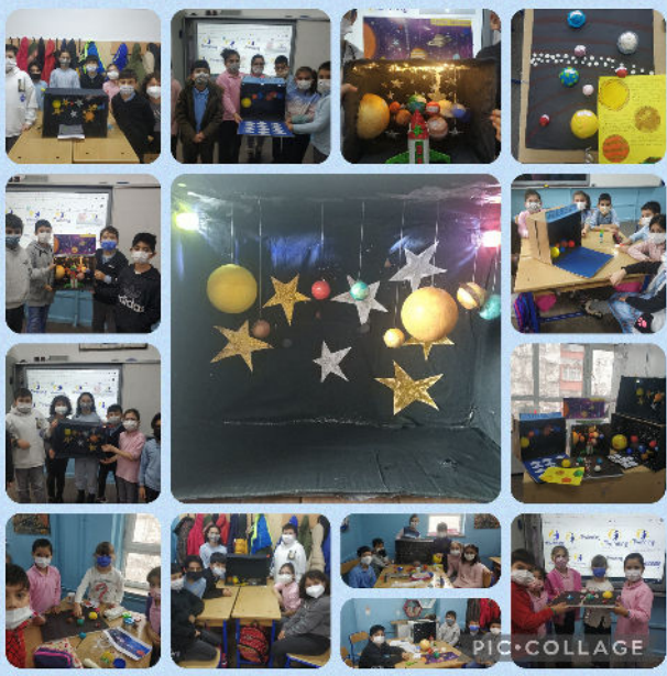
GÜNEŞ SİSTEMİ MODELLERİMİZ